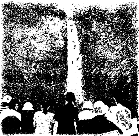
華嚴の滝は、展望台にまで水しぶきが飛んできて、ものすごい迫力でした!

児童は班ごとに係分担をして、各係ごとに自分たちで考え工夫し、自分たちで創り上げる日光移動教室にしようとする姿がたくさん見られました。班のメンバーをまとめ、すすんで行動しようとしていた班長、みんなが楽しめるようにたくさんのアイデアを出してキャンプファイヤーやナイトレクの準備をしてきたレク係、気持ちよく食事ができるように準備をした食事係、友達の健康を気遣うことができた保健美化係、みんなで使う浴室や寝具などをきれいに片付けていた寝具入浴係……。自分だけでなく、みんなが楽しく、気持ちよく過ごすことができるように、それぞれの児童が意識して3日間を過ごすことができました。