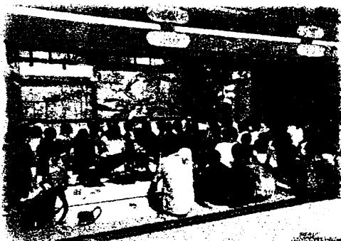
江戸村での寺子屋学習