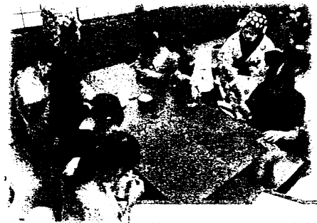
昔のおもちゃ作り体験

1日目は、日光江戸村で江戸の街を散策し、昔のおもちゃ作りや寺子屋学習など様々な体験をしました。夜はきれいな星空の下、キャンプファイヤーを行い、ゲームやダンスをして盛り上がりました。2日目は、切込湖・刈込湖ハイキングに華嚴の滝の見学。夜はナイトレクを行いました。3日目は、東照宮を見学し、日光の歴史について学びました。