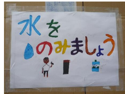
手製のボードを持って児童が会場内を巡回