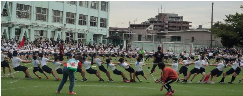
6年生 6年生の野望～伝説の闘い～