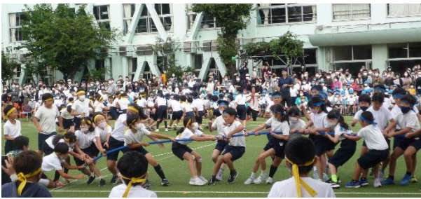
3年生 ダッシュ! 奪取!! 網取り!!!