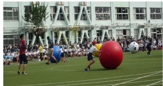
2年生 大玉ころがし