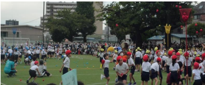
1年生 ダンシング玉入れ